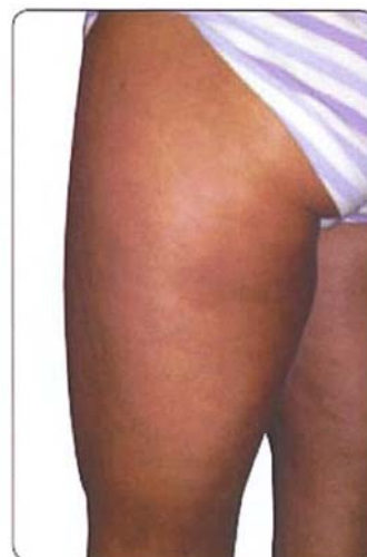
ETTER 6 mnd. bruk av Marine Matrix

Disse bildene viser hvordan huden er før og etter seks måneders bruk av kosttilskuddet kollagenhydrolysat (marine Matrix).