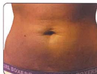
ETTER 6 mnd. bruk av Marine Matrix